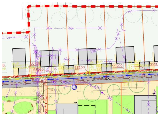
situace - napojení na dopravní a technickou infrastrukturu