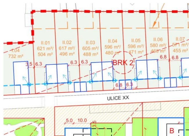
situace - regulace umístění domu na pozemku