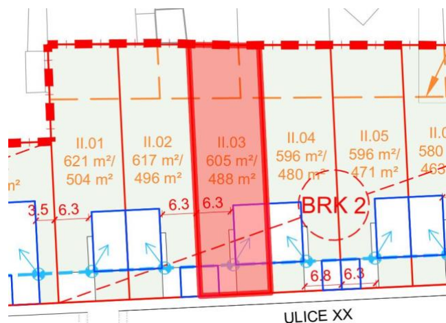
situace - rozsah předmětu prodeje