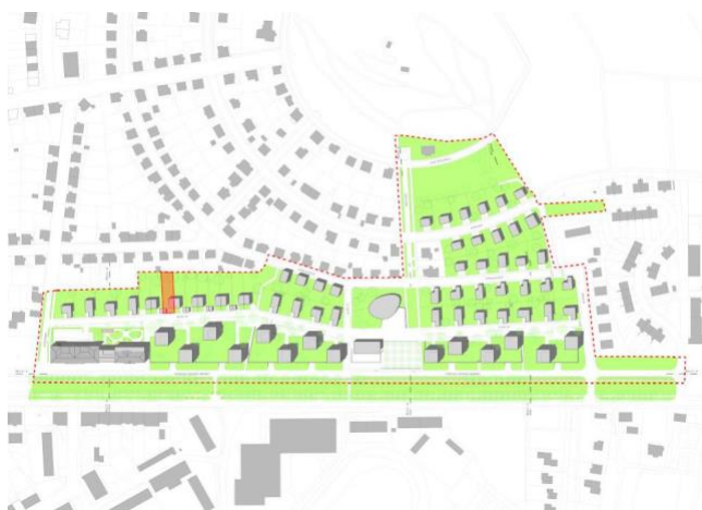
situace - umístění pozemku v širších vztazích

Možné typy domů: typ D - obestavěný prostor 701m 3 více viz výňatek z Katalogu rodinných domů Kasárna Jičín na následujících stranách (kompletní Katalog rodinných domů kasárna Jičín je dostupný elektronicky pod odkazem www.kasarna.jicin.cz ). Vnitřní dispozice domu má pouze informativní charakter, není závazná.